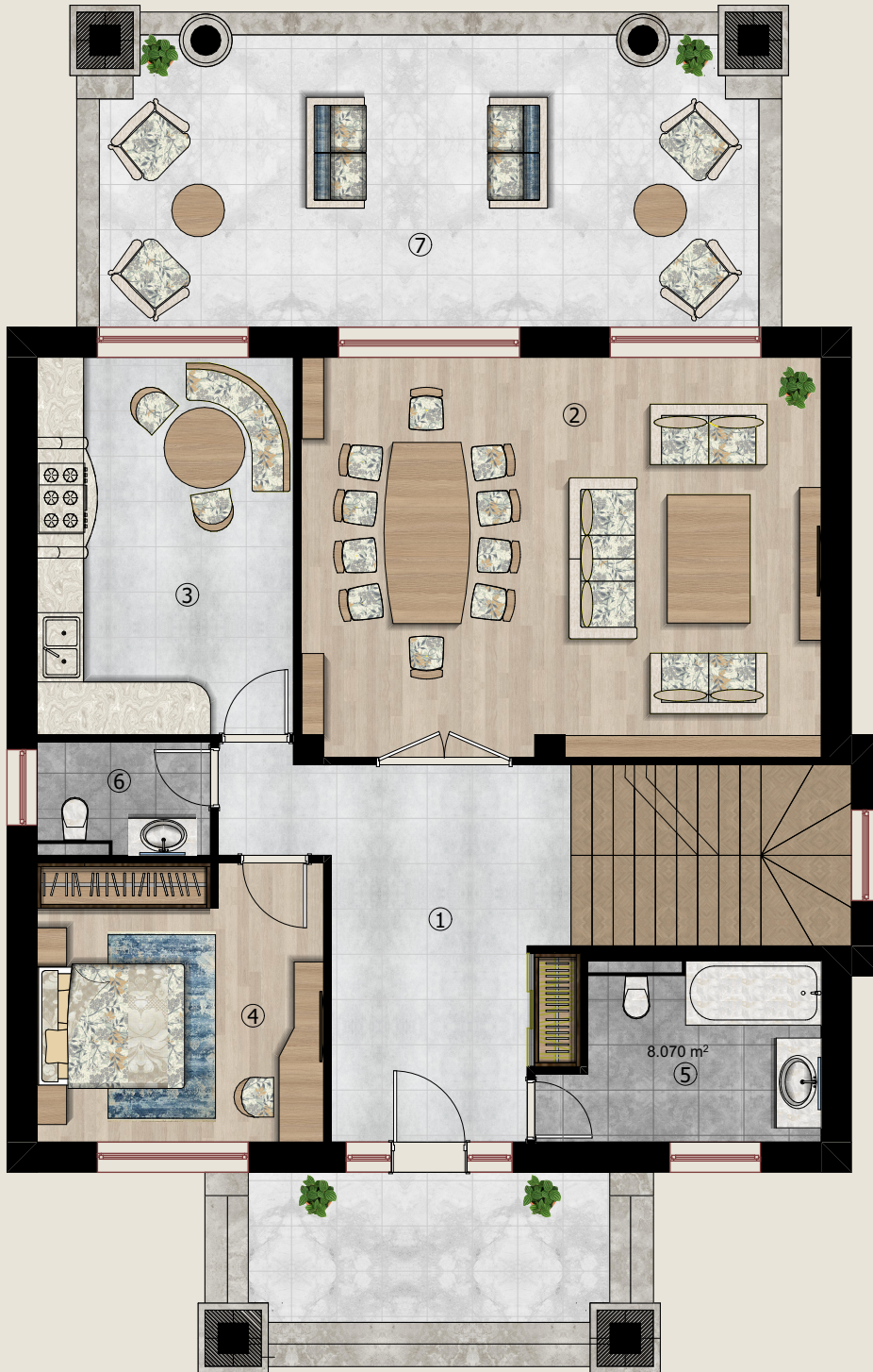
1-ci mərtəbənin planı