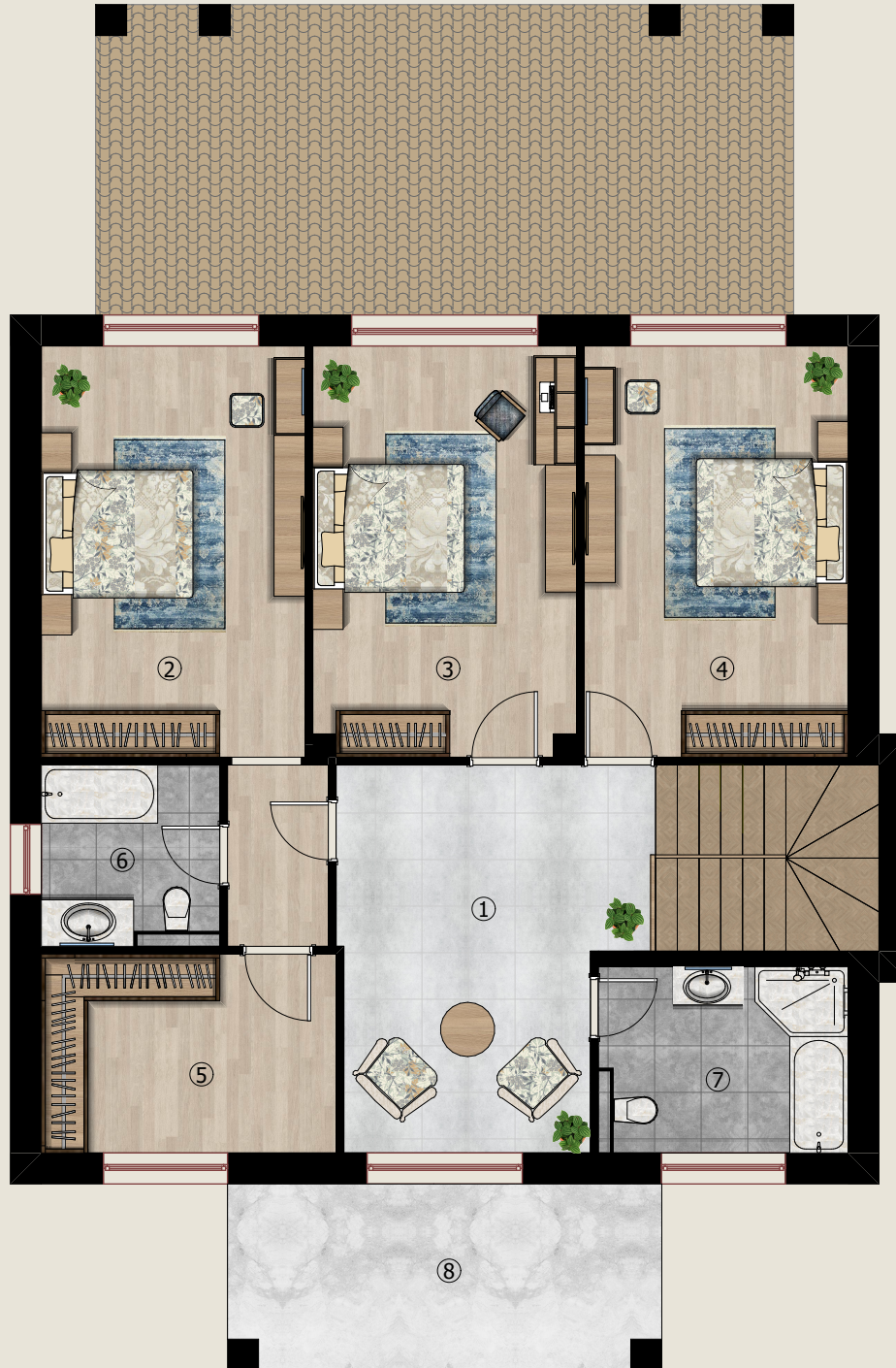
2-ci mərtəbənin planı